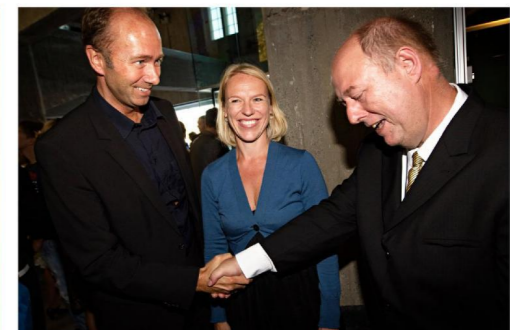
Da næringsminister Trond Giske sammen med kulturminister Anniken Huitfeldt og Rockheim-sjef Arvid Esperød under den offisielle åpningen av Rockheim 5. august 2010.